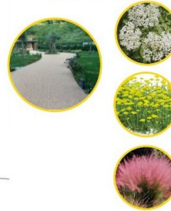
SUGGERZIONI PIAZZALE SERVENTI