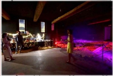
SUGGERZIONI EX-TEATRO: SALA CIVICA POLIVALENTE